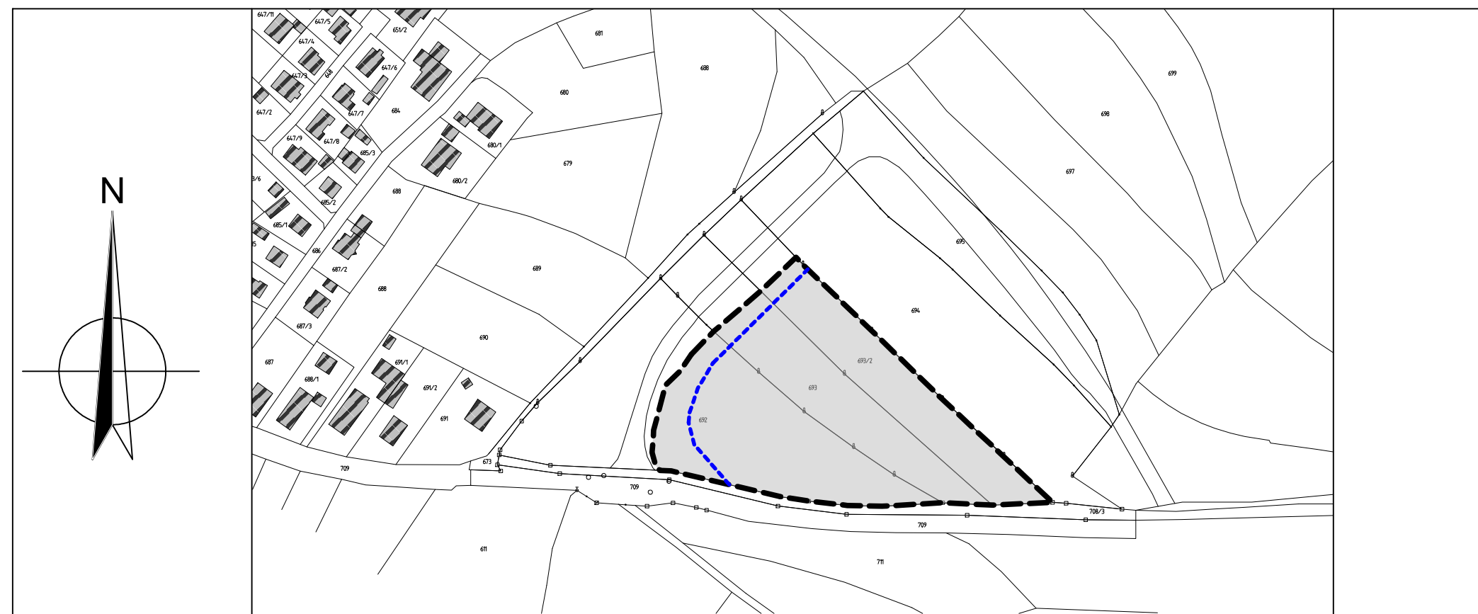
8. ÄNDERUNG DES FLÄCHENNUTZUNGSPLAN DER STADT STADTSTEINACH 1:2.500