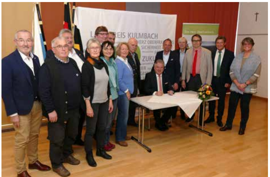
Bild: Unterzeichnung der Gründungssatzung im Beisein von Staatsminister Thorsten Glauber (5.v.r.), Regierungsvizepräsident Thomas Engel (4.v.r.), Bürgermeister Roland Wolf- rum (3.v.r.), MdL Rainer Ludwig (2.v.r.) und Beate Krettinger (rechts)

https://www.stmuv.bayern.de/themen/naturschutz/naturschutzfoerderung/landschaftspflege_naturparkrichtlinien/index.htm