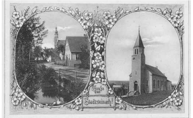
Die neu erbaute evangelische Pfarrkirche auf einer „Gruss aus“ – Karte um 1910.