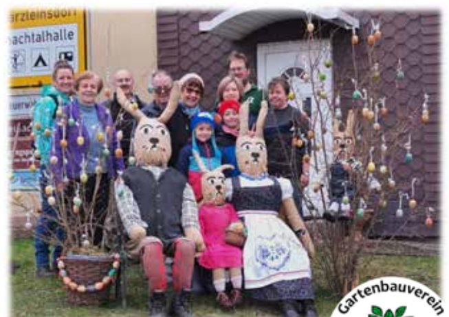
Frühjahrsbepflanzung am „Tempelseck“.