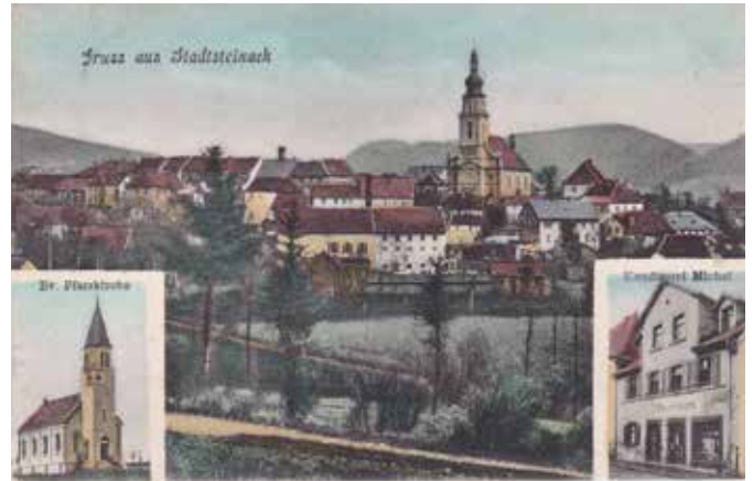
Ansichtskarten aus dem Jahre 1910 mit den zwei neuen, stolzen Gotteshäusern.