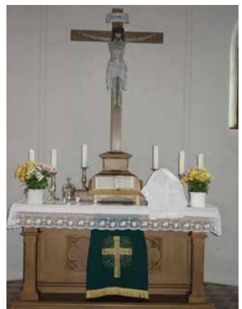
Der Altar in der Christuskirche Stadtsteinach.