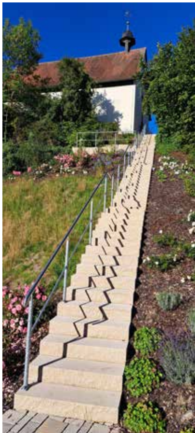
Seit 2023 führt vom Mühlenpark in der Wehrstraße in Stadtsteinach eine Treppe hoch zur Marienkirche.