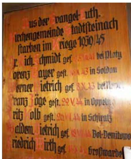
Gedenktafel der Gefallenen in der evangelischen Kirche Stadtsteinach.