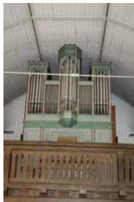
Die Orgel in der Christuskirche Stadtsteinach.