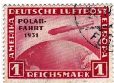
Die Reichspost gab anlässlich der Polarfahrt 1931 verschiedene Briefmarken heraus, die zur Frankierung der Post via Luftschiff Verwendung fanden und heute begehrte Sammelobjekte sind.