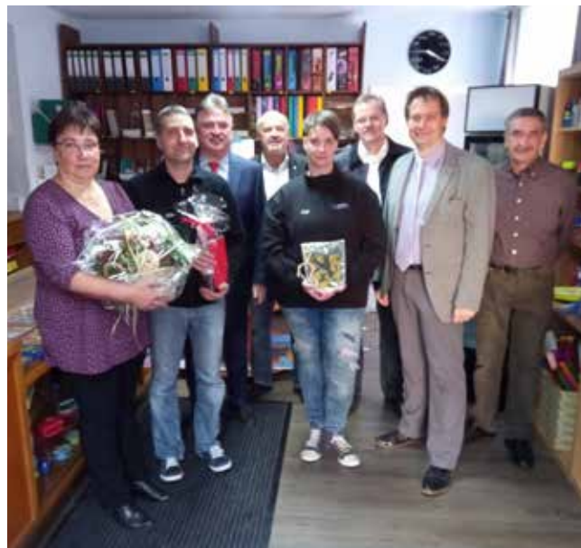
Glückwünsche zur Wiedereröffnung des Schreibwarengeschäftes Winterstein überbrachten Stadt und Land.

Abgerundet wird das ganze durch einen DHL Paketshop und dem Verkauf von Briefmarken.