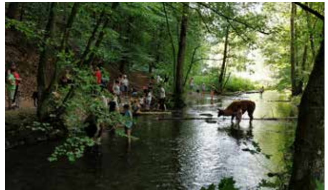
Abkühlung für Mensch & Tier

Cantabene begrüßt und mit mittelalterlichem Gesang in eine andere Zeit verführt. Nach einigen Liedern und Geschichten zum Burgeschehen stürmten die Kinder den Berg hinab zur Waldschänke, um sich zunächst im Wasser abzukühlen und sich danach beim Malen und verschiedenen Ballspielen zu vergnügen. Max Haueis verteilte abschließend Teilnehmerurkunde an alle Kinder. Rundum, es war für alle Beteiligten ein ereignisreicher Nachmittag, sehr zur Wiederholung empfohlen.