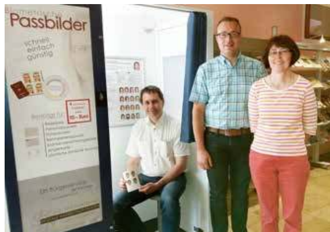
1. Bürgermeister Roland Wolfrum beim Anfertigen der ersten Passaufnahme in dem neuen Automaten.

Auch für die Mitarbeiter der Gemeinde ist es eine große Erleichterung, da die Passbilder nicht mehr eingescannt werden müssen. Durch die Anbindung des Automaten an das Computernetzwerk der Gemeinde überträgt der Automat zusätzlich die Bilddaten auf deren Netzwerkserver. Von dort können die Mitarbeiter des Passamtes die Bilddaten bequem und vor allem ohne Qualitätsverlust abrufen. Natürlich ist hierbei auch der Datenschutz gewährleistet: Dem Fotoautomaten und der dazugehörigen Software wurde das Gütesiegel der Datenschutzauditverordnung (DSAVO) verliehen. Durch diese Zertifizierung ist der Schutz der persönlichen Daten garantiert.