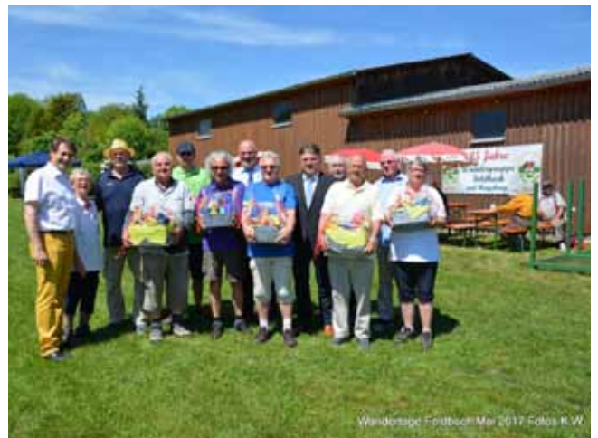
Im Bild die Vertreter der teilnehmerstärksten Gruppen und Ehrengäste - von links!