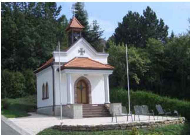
Es lädt herzlich ein Soldatenkameradschaft Zaubach

Im Anschluss an die Feierlichkeiten findet wieder ein gemütlicher Familiennachmittag mit Kaffee und Kuchen am Feuerwehrhaus statt.