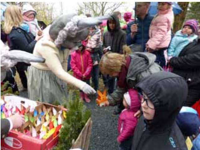
Foto: Inmitten der Kinder stehend teilen die beiden Osterhasen die gebastelten Nester an die Kleinen aus. kpw