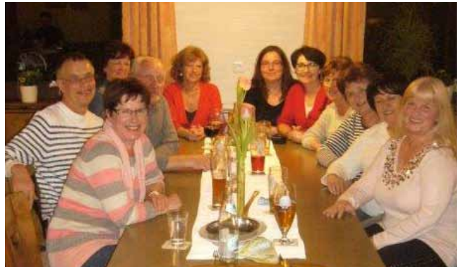
Das Bild zeigt die gesellige Runde.